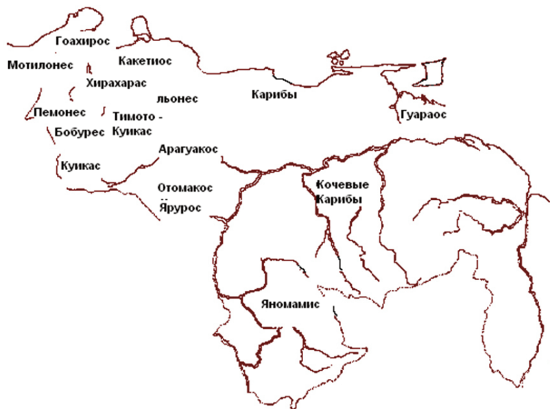
Рис 125 Карта племена, по мнению А.М Саинес