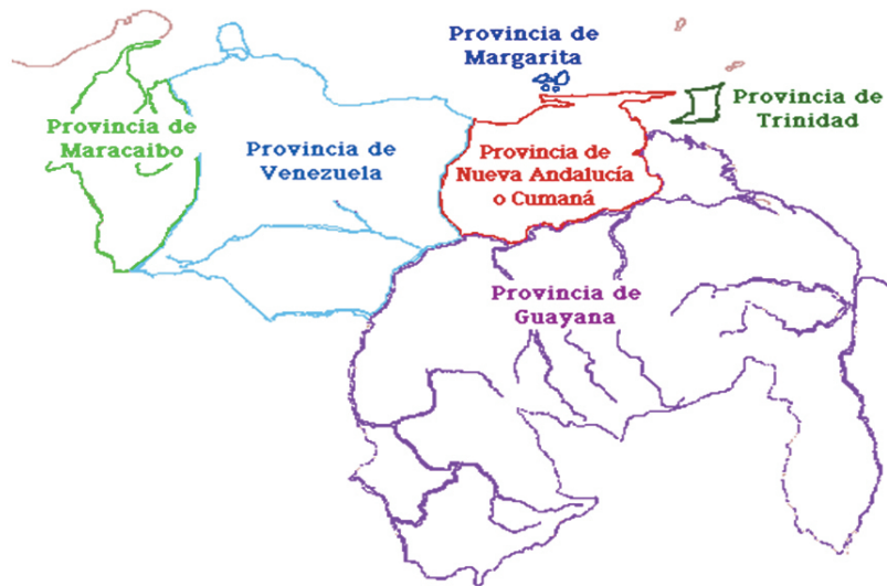
Рис 3326. Карта соединения провинций современной территории Венесуэлы

Территориальная эволюция провинций была очень разнообразной, долгое время различные провинции были практически независимы друг от друга, с губернаторами, назначенными Испанией. Территориальный союз достигнут только в 1777г. Территориальная унификация Венесуэлы была осуществлена четырьмя административными действиями: