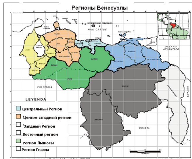
Рис 12 Схема экономических регионов Венесуэлы

72 Echeverrias Manuel. Rol de las Regiones en el sistema Internacuional. Monografia. Pag 85- v -1999